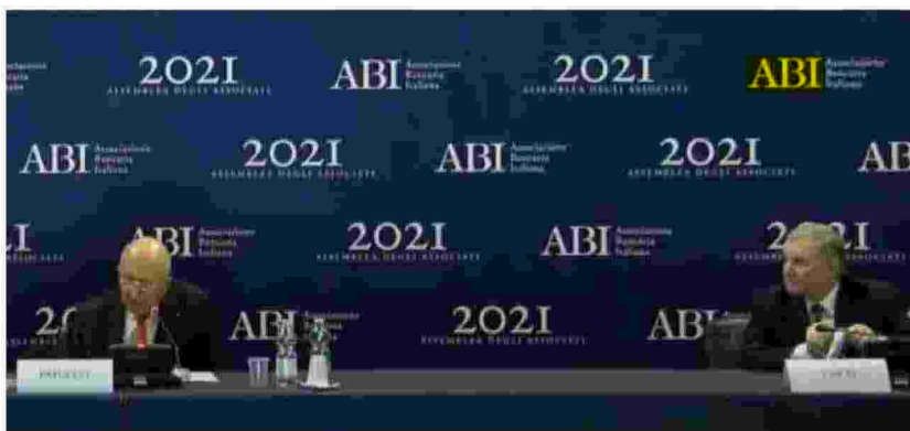
Il presidente dell'Abi e de La Cassa di Ravenna spa, Antonio Patuelli, e il governatore di Bankitalia, Ignazio Visco