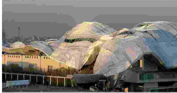
Il MiCo di Milano, sede del Salone dei pagamenti 2022