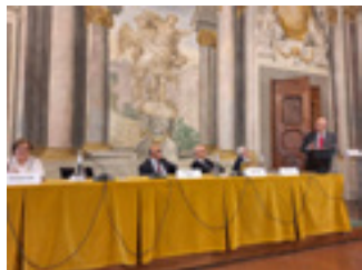
'Raffaele Mattioli: il banchiere, l'intellettuale, il politico'