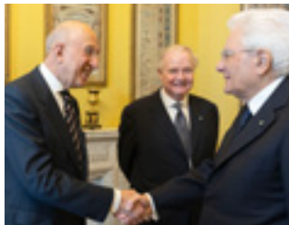
Quirinale: Mattarella ha ricevuto una delegazione della FEduF

Il Presidente della Repubblica, Sergio Mattarella, ha ricevuto al Quirinale una delegazione della Feduf, Fondazione per l'e-