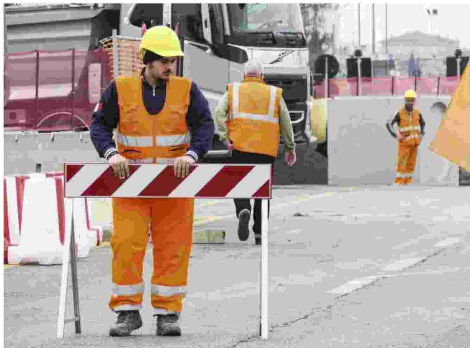
Operai al lavoro. Il Pnrr in Italia sta avendo difficoltà nel realizzare i programmi decisi e condivisi con Bruxelles

«Ci stiamo giocando una partita importante di credibilità, fondamentale nei negoziati sui tavoli europei».